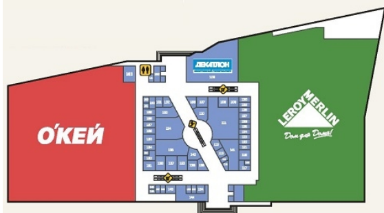
СХЕМА 1 ЭТАЖА